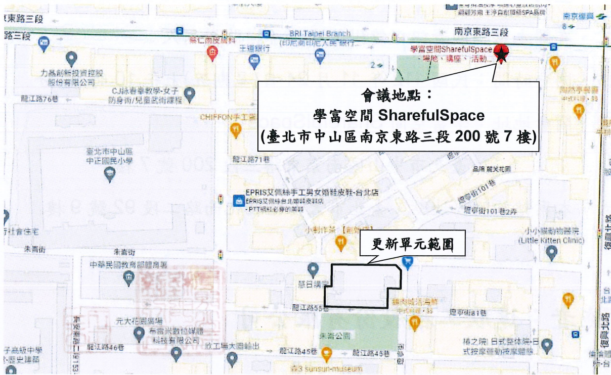
圖 2 開會地點位置示意圖