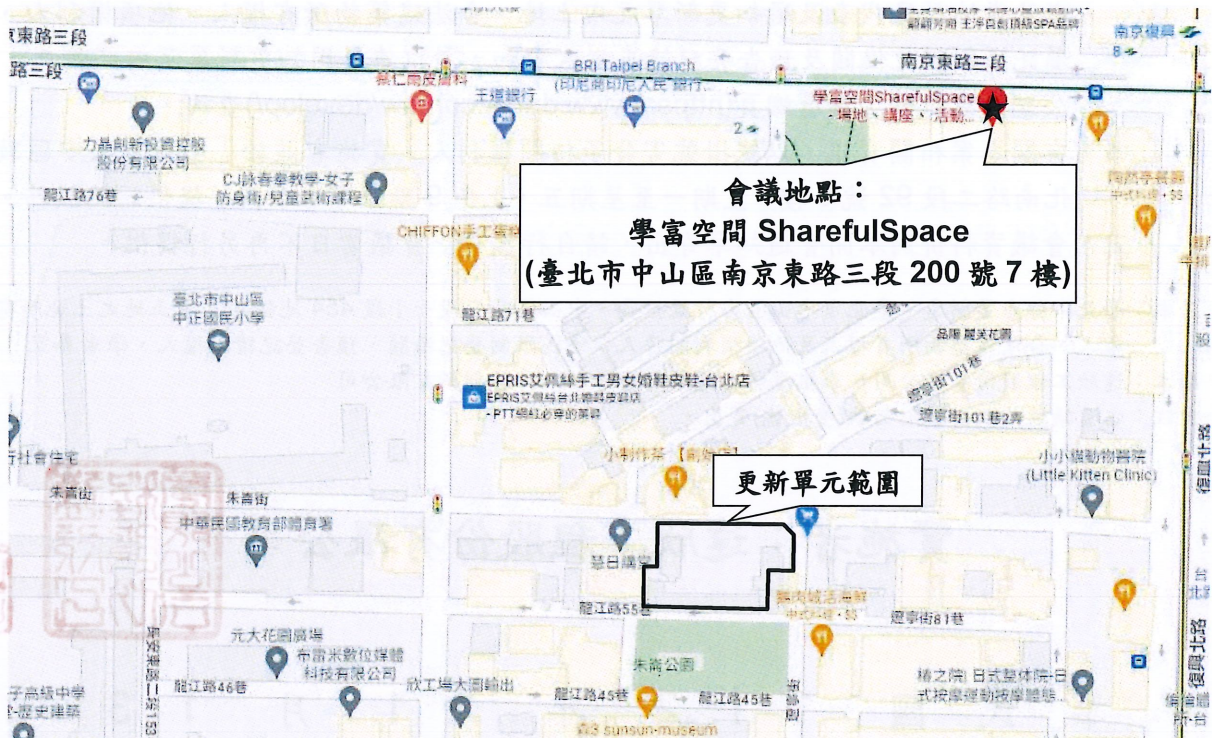
圖 2 開會地點位置示意圖